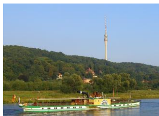
Dampferfahrt auf der Elbe, Fernsehturm