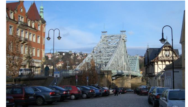
Elbbrücke „Blaves Wunder“