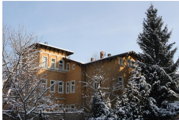
Villa Elsa Südseite

Das Gästehaus kann auch komplett gemietet werden, Fewo 1+2 (max. 6 Pers.)